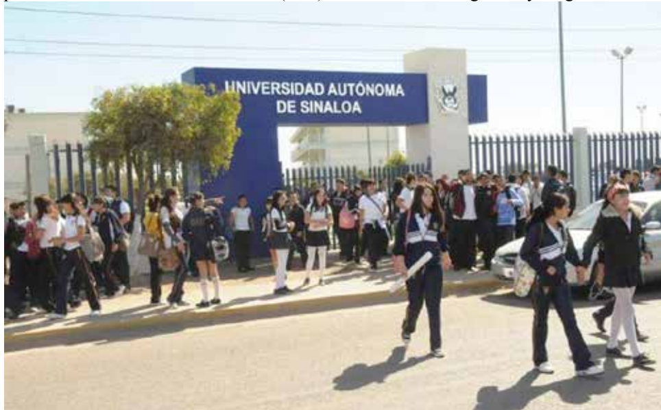
Entrada de la Universidad Autónoma de Sinaloa.

La asociación de jubilados y pensionados pasa por un proceso de unidad y lucha interna la cual era y es necesaria, pero debemos pasar a una etapa de UNIDAD para enfrentar al enemigo real, que son este grupo reaccionario de charros, sindicales y rectores.