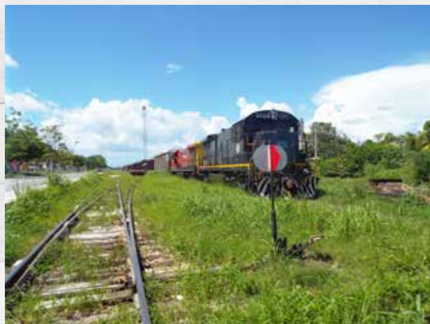
El "Tren Maya" es el principal megaproyecto de la 4ªT.

de Vivienda Social hacia las zonas económicas especiales que según AMLO ya habían desaparecido. Y de