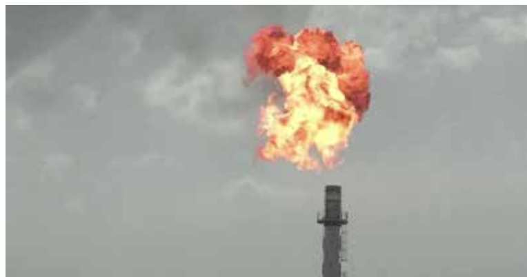
Venezuela, uno de los países con mayor producción de petróleo, se ha visto orillado a esta crisis por la presión del imperialismo.

en los asuntos de Venezuela, ha provocado llevar el conflicto no sólo en la profundización de las contradicciones entre un país dependiente y el imperialismo, sino también entre las propias potencias imperialistas, que no tienen una final a la vista.