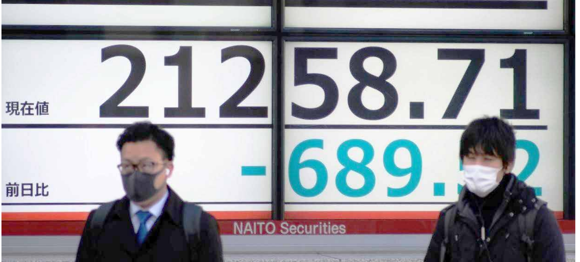
El mercado chino fue el primer golpeado, más los demás países están siendo golpeados.