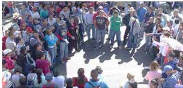
Asamblea de los docentes durante movilización de la sección XVIII.

derecha. Las instancias de dirección de la Coordinadora Nacional, que en su momento fueron omisas, complacientes o cómplices ante la traición de Zavala y su séquito, ahora deberán empeñar todos sus esfuerzos para reconstruir la unidad de dicho contingente a partir de la reivindicación de los Principios Políticos e Ideológicos de la misma. En estos momentos, es de estratégica necesidad mantener la unidad desde las bases y velar por la independencia política respecto al Estado, los partidos políticos electoreros y recuperar las tácticas de las luchas traicionadas por los gobiernistas.